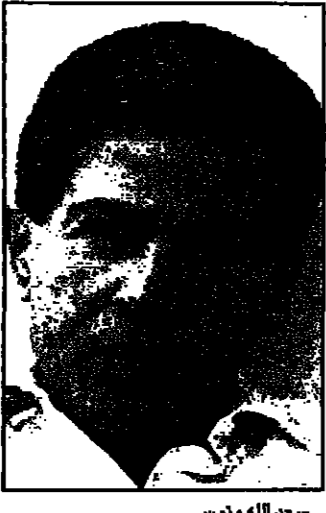
القاهرة - من محمد ناجي

استضاف سعد الله ونوس الذي لا يموت كما وصفته الفنانة اللبنانية نضال الاشقر جمهور المسرح في القاهرة في سهره مع (طقوس الاشارات والتحويلات) وهي مقتبحة عروض المسرحية تقدمها فرقة مسرح المحبة البيروتية وتتواصل لمدة اسبوعين بالقاهرة.